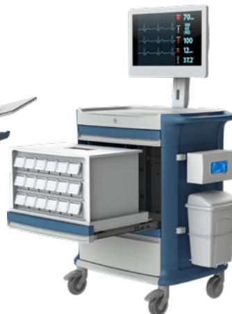
Medikamentenwagen mit IT-Anbindung