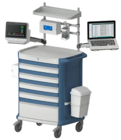
Behandlungs-/Verfahrenswagen mit IT-Anbindung