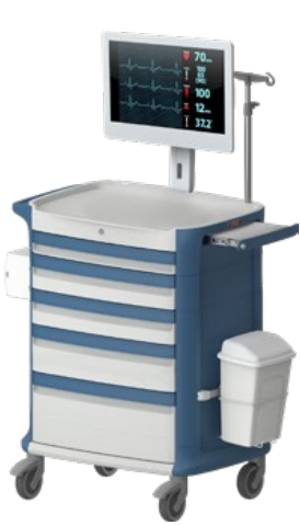
Pflegewagen mit IT-Anbindung